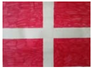
Le drapeau savoyard dessiné par Alice B.

Le département de la Savoie est un département de la région Auvergne-Rhône-Alpes, dont le chef lieu est la ville de Chambéry. Création du département : 15 juin 1860.