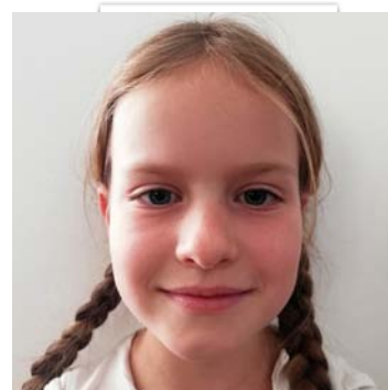
ALICE B. CE